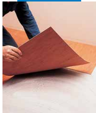
Τοποθέτηση επικάλυψης από ομογενές PVC σε μορφή πλακιδίου με Adesilex V4