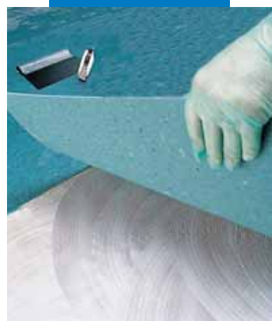
Τοποθέτηση πλακιδίων από ομογενές PVC