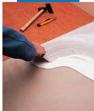
Εφαρμογή της Adesilex V4 για την τοποθέτηση πλακιδίων από ομογενές PVC