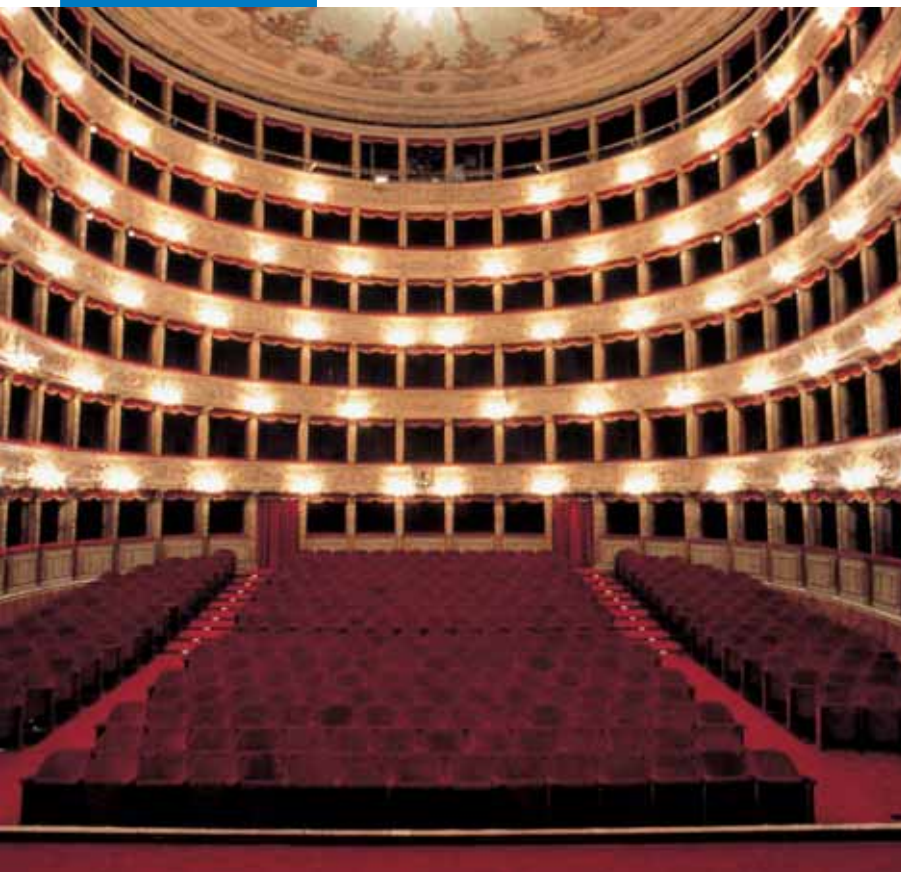
Θέατρο Argentina - Ρώμη. Μοκέτα Liuni τοποθετημένη με Adesilex V4

Οι επιφάνειες πρέπει να είναι στεγνές, απορροφητικές, επίπεδες, με μηχανικές αντοχές, απαλλαγμένες από σκόνη, χαλαρά μέρη, ρωγμές, βερνίκια, κεριά, λάδια, σκουριές, ίχνη γύψου και άλλα προϊόντα που μπορούν να επηρεάσουν τη συγκόλληση.