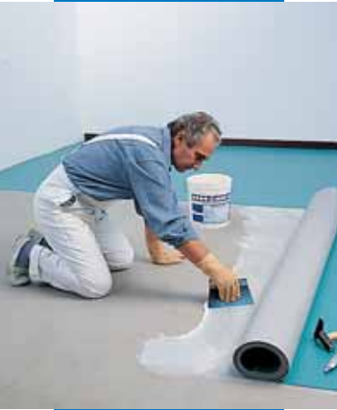
Εφαρμογή της Adesilex V4 για την τοποθέτηση συνθετικού PVC σε ρολό